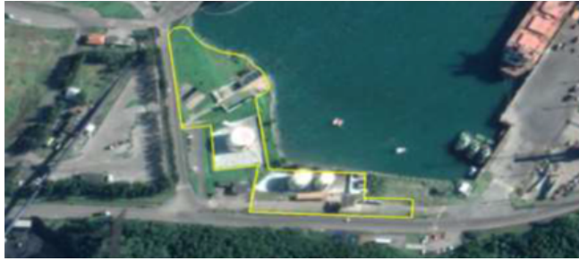
Figura 03: Poligonal da área A4 definida em PDZ (antigo Terminal de Granéis Líquidos)

115. Tendo em vista que parte da área A4, a oeste, não possui infraestrutura, superestrutura nem equipamentos necessários para a operação do Terminal de Granéis Líquidos, neste estudo está sendo previsto a licitação da área IMB05 conforme poligonal da figura abaixo, excluindo a área mencionada.