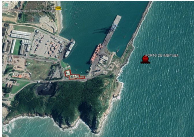
Figura 01: Área de arrendamento IMB05/SC.

19. A área de arrendamento a que se refere este estudo de viabilidade, denominada IMB05 , está localizada dentro da Poligonal do Porto Organizado de Imbituba-SC, possui 7.455,00 m 2 , e será destinada à movimentação, armazenagem e expedição de granel líquido, especialmente soda cáustica. A sua localização está indicada na figura a seguir: