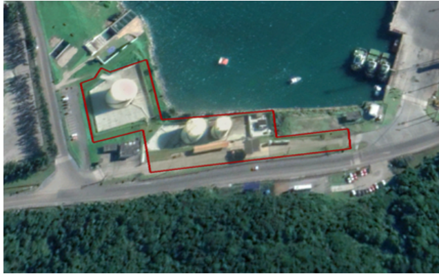
Figura 04: Poligonal da área IMB05 a ser licitada

115. Tendo em vista que parte da área A4, a oeste, não possui infraestrutura, superestrutura nem equipamentos necessários para a operação do Terminal de Granéis Líquidos, neste estudo está sendo previsto a licitação da área IMB05 conforme poligonal da figura abaixo, excluindo a área mencionada.